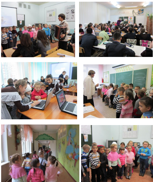
Беренче сыйныфка керуче укучылар өчен «Ачык ишекләр» көне уздырылды.

«Яшь белгечләр» номинациясендә жинүче укытучыларыбыз: