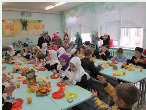
Корбан бэйрәме мөбэрәк булсын!