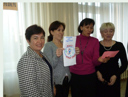
Сингапур уклары тәмамлангач, укытучылар үзләренәк пректларын якладылар.